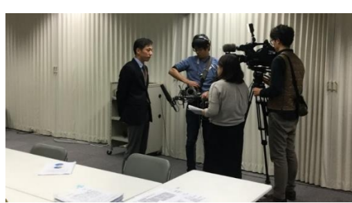
活動に関する取材風景