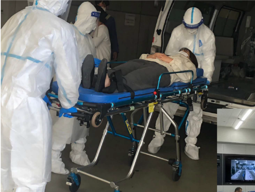
R5. 11. 9 (患者搬送訓練)