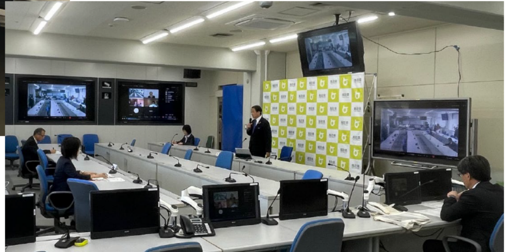
R5. 11. 9 (対策本部運営訓練)