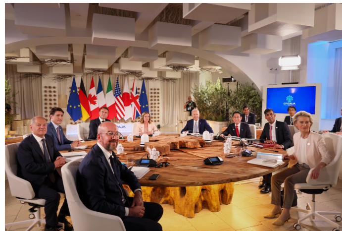
G7プーリアサミットの様子